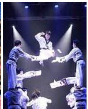
Kukkiwon Demo Team