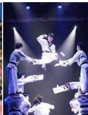
Kukkiwon Demo Team