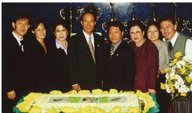
Gms Introdutores e família tradicional do Taekwondo no Brasil